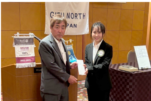
米山奨学生ピヨさんへ奨学金の支給