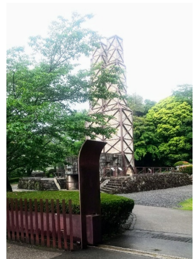
6月2日 にらやま 葦山反射炉