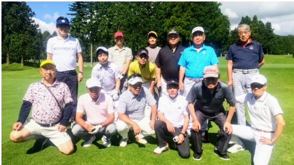
6月4日 太平洋クラブ 御殿場コース