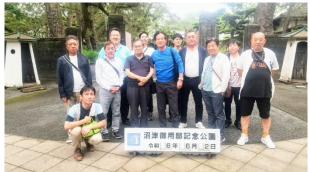
6月2日 沼津御用邸にて