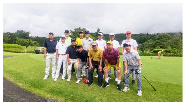
6月3日 三甲ゴルフクラブ 富士コース