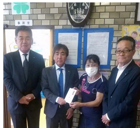
若松学園へ寄付金贈呈