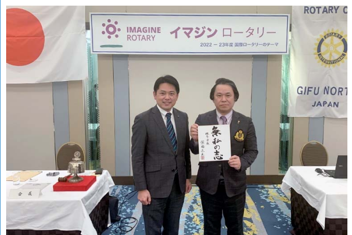
柴橋市長と川崎会長