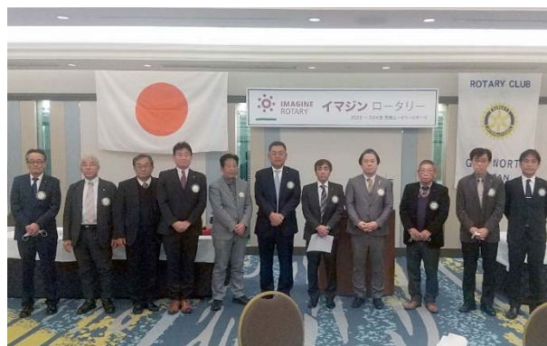
次期役員・理事のみなさん