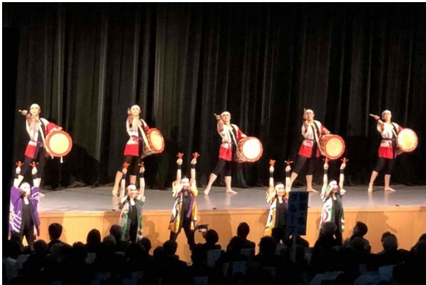
かやの木学園「響き」和太鼓とダンスの融合