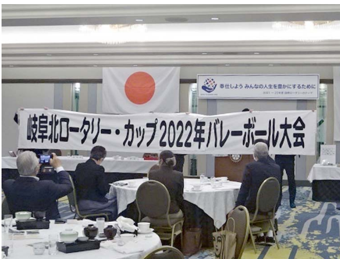
バレーボール大会横断幕の披露