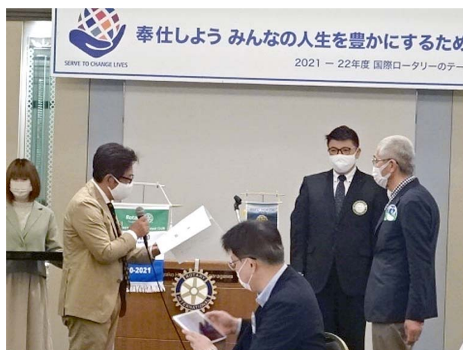
岐阜市北部西部バレーボール競技会様へ 40周年記念品(目録)贈呈