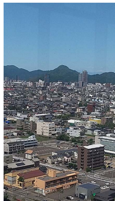
清流ロビー（展望フロア）からの眺め