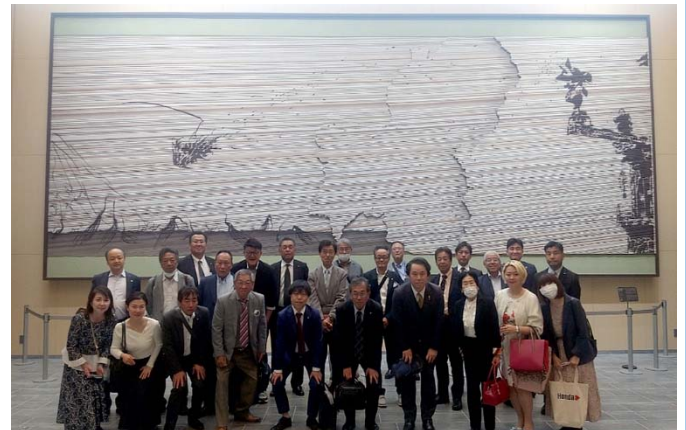
ロビーにて集合写真