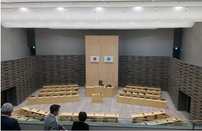
本会議場 傍聴席より