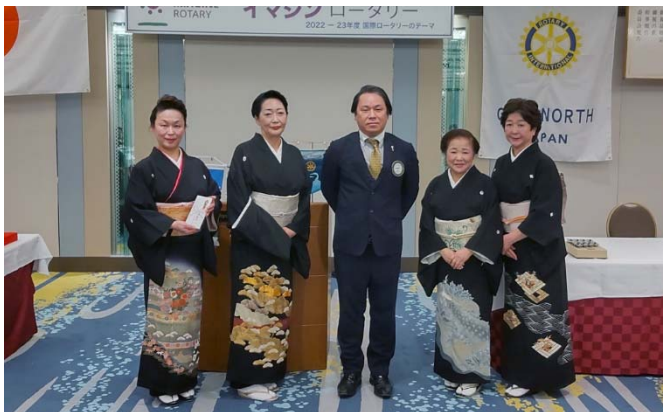
岐阜検番の皆様と川崎会長